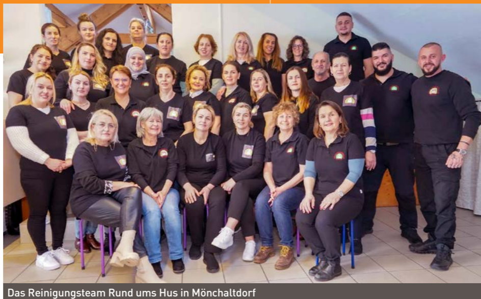
Das Reinigungsteam Rund ums Hus in Mönchaltorf